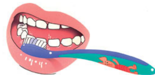
2. Dan de buitenkant