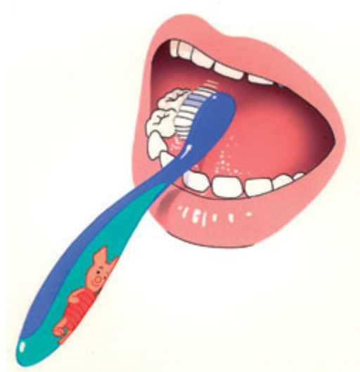
1. Begin beneden met de binnenkant.

Poets volgens de 3 B's: B innenkant, B uitenkant, B ovenop.