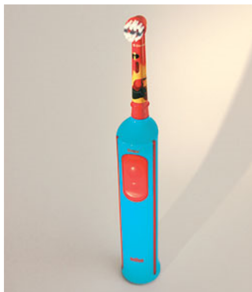
Elektrische tandenborstels voor kinderen hebben een speciale kleine borstelkop

Gebruik een tandenborstel met een kleine borstelkop met zachte haren en bij voorkeur met een lange steel. Zo komt u overal makkelijk bij. Kinderen vanaf drie jaar kunnen ook elektrisch poetsen. Er zijn speciale kinderborsteltjes. Die zijn kleiner en daarom geschikt voor de kindermond. Poetsen met een elektrische tandenborstel is juist leuk voor kinderen. Het draagt bij aan de motivatie om het gebit goed te verzorgen. Kies een tandpasta met fluoride. Fluoride zorgt voor de versterking van het glazuur. Voor kinderen tot en met vier jaar zijn er speciale peutersandpasta's. Hierin zit minder fluoride. Vanaf het vijfde jaar kan uw kind normale fluoridetandpasta voor volwassenen gebruiken. Er zijn ook tubes verkrijgbaar waarop staat 'juniortandpasta'. Kijk dan altijd naar de leeftijd die hierbij wordt aangegeven (bijvoorbeeld 5-12 jaar). Doe niet te veel tandpasta op de borstel. Een halve tot één centimeter is al voldoende.